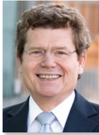
Oberbürgermeister der Stadt Würzburg

Grußwort anlässlich des Datenschutzkongresses IDACON vom 11. bis 13. Oktober in Würzburg